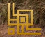
Une action chrétienne dans un monde en détresse

PROJET DE FORAGE A EAU POTABLE APPUI DES ONGs: SEL-ADSPE KEDJI - Préfecture de VO